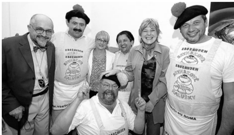
Počas veselého nedeľného PIKNIKU si môžu návštevníci zadarmo pochutnať na bryndzových haluškách, ktoré priamo pred ich zrakmi pripravujú Majstri sveta vo varení a jedení halušiek.