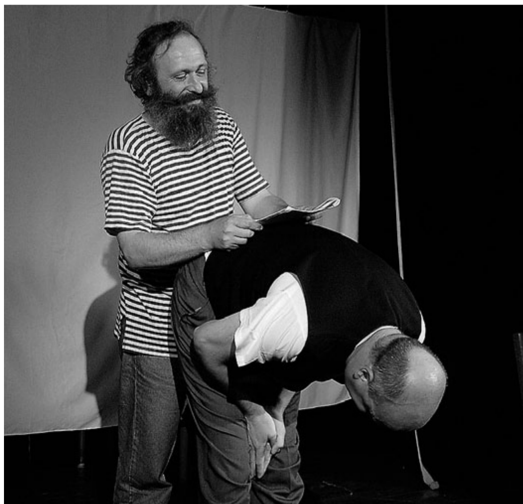
Na 25. ročníku Kremnických gagov oprášilo Kremnické divadlo v podzemí úvodnú hru z nultého ročníka Slovenských gagov NON TEATRO BUFFO alebo Sáaga gagu slovenského.