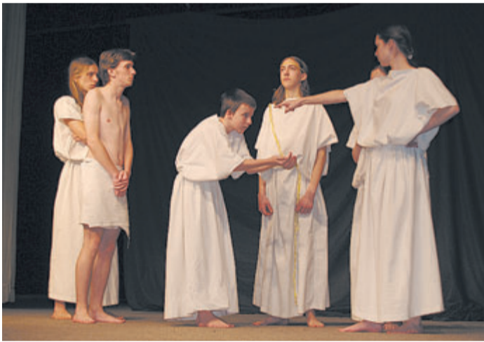
Štúdio Kasprzyk: Ezop

názvom 5 X S NADHLEDEM a špičkový maďarský mím Csaba Méhes zabaví deti i dospelých predstavením KVINTETO PSTRUH, alebo HLUCHÝ RYBÁR A MORE. Obe predstavenia sú už na začiatku festivalu, tak nech vám neujdu...!