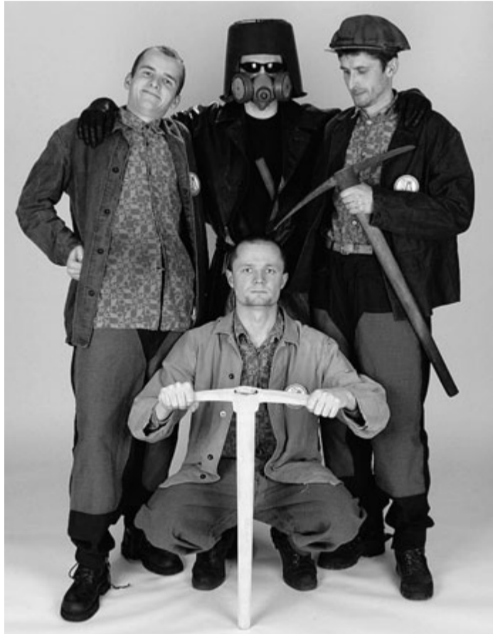
Autorská jednoaktovka divadelného súboru Čtyřlístek ING Kolektiv z Frýdku Místku vyhrala v roku 2004 „národní přehlídka jednoaktovek“ ČR a úspěšně sa zúčastnila 74. Jiráskova Hronova.