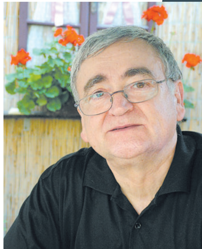
Stanislav Štepka, autor RND a prezident AHS