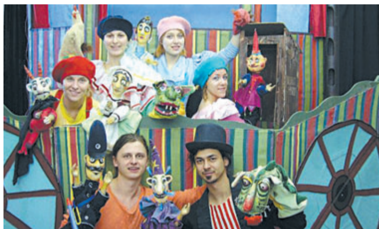
Študenti bábkarskej katedry VŠMU zahrajú pre deti Gašparka.