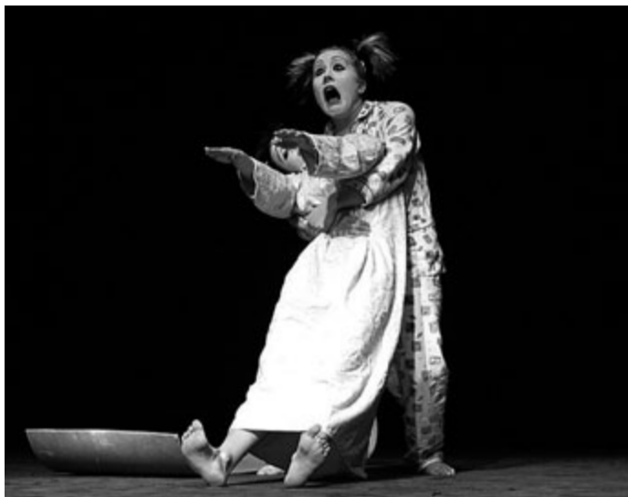
Na festivale vystúpi aj Divadelný súbor nepočujúcich DIKO SOU Kocelova z Bratislavy.