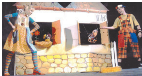
Divadlo Pimprlo zo Žiliny uvedie rozprávku RÓZA a IMRO